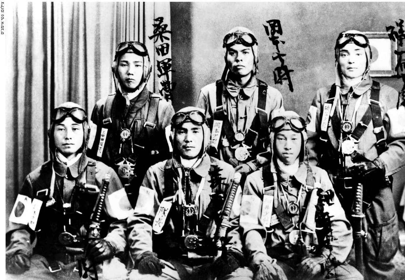
טייסי קמיקזה יפנים. לא כל משימות ההתאבדות הסתיימו בהצלחה